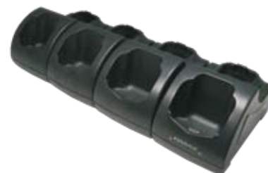
Mehrfach Lade-/Übertragungsstation (Ethernet)

Weitere Einzelheiten können Sie dem Benutzerhandbuch auf www.mobile.datalogic.com/manuals entnehmen. Mehr Informationen auch unter www.mobile.datalogic.com/datalogicjseries