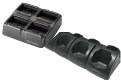
Einfach Lade-/Übertragungsstation und mehrfach Akkuladestation