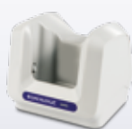
91ACC0072 Einfach- Ladestation mit Verschluss