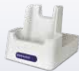
91ACC0073 Einfach- Ladestation nur zur Ladung