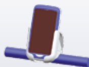
91ACC0047 Einkaufswagenhalter (60 St.)